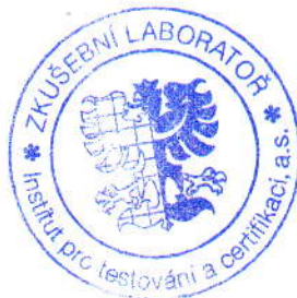
Doc. Ing. Vladimír Klepal, CSc. vedoucí zkušební laboratoře

Objednavatel: PRAGOELAST spol. s r.o. IČ: 62954610 Adresa: Na Cikánce 2 153 02 Praha 5 - Radotín Vzorek: Pryžový kompozit na bázi druhotných surovin typ FS 700 Zadání: Hodnocení technických parametrů viz. str. 2 Datum přijetí vzorku: 12. 11. 2008 Vypracoval: Milan Borský Místo a datum vydání: Zlín, 9. 12. 2008