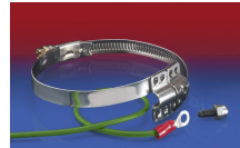
CLAMP 212 EC