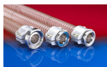
CONNECT SAFETY CLAMP ASSEMBLY 231