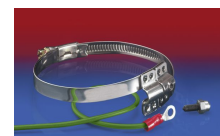
CLAMP 212 EC