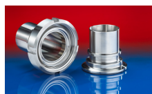
CONNECT ASEPTIC FITTING 249