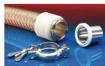
CONNECT TRI-CLAMP FITTING 245