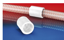
CONNECT 246 FOOD