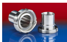
CONNECT DAIRY FITTING 247