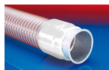
CONNECT 243 FOOD