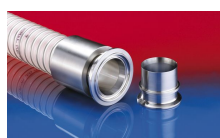
CONNECT PRESS ASSEMBLY 232