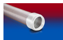
CONNECT 245 FOOD