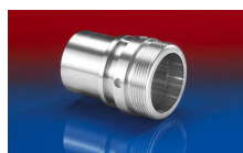
CONNECT THREAD FITTING 234