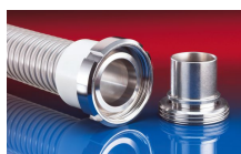
CONNECT MOULD ASSEMBLY 233